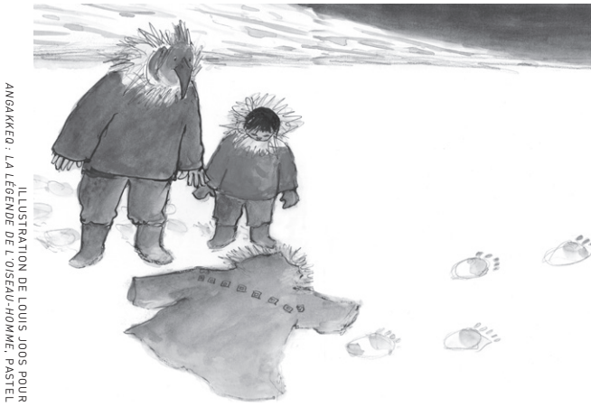
ILLUSTRATION DE LOUIS JOOS POUR ANGAKKED : LA LÉGENDE DE L'OISEAU-HOMME. PASTEL