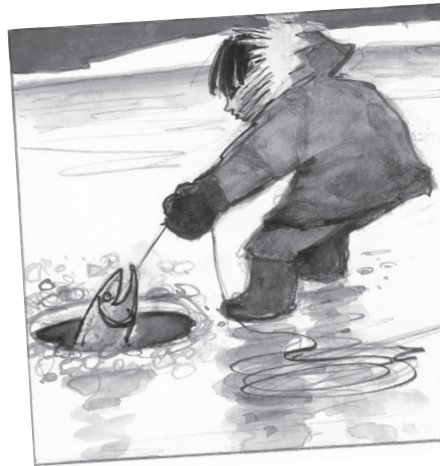
ILLUSTRATION DE LOUIS JOOS POUR LE SOURIRE DE KIAWAK. PASTEL

Livres polaires encore, Le sourire de Kiawak , avec de magnifiques portraits d'enfants, et Le rêve de l'ours où domine un autre de vos thèmes de prédilection: l'opposition de l'ombre et de la lumière, des mondes anciens et du monde moderne... Les scènes nocturnes sont superbes. Et des ours comme héros: il y a beaucoup d'ours dans vos livres!