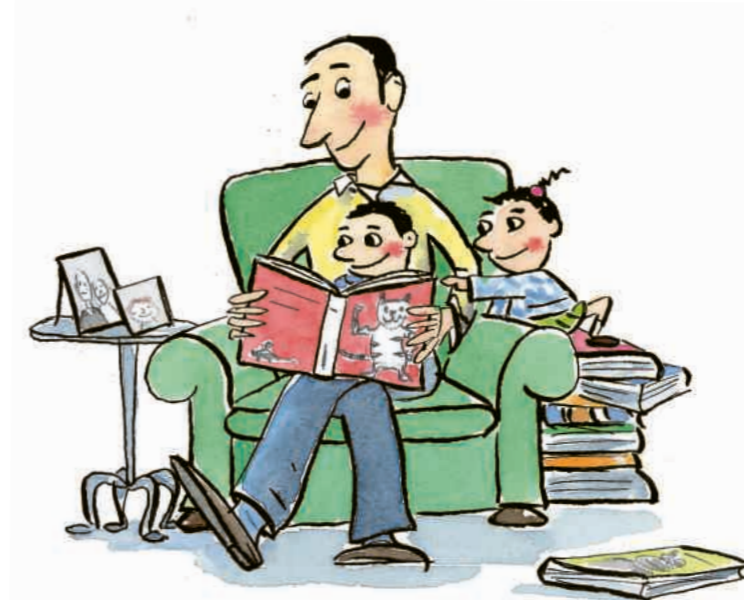
Illustration: Claudia de Weck. Mise en page: Manuel Süess

Les livres ouvrent de nouveaux mondes. Raconter des histoires vous permet à vous et à votre enfant de partager des découvertes.